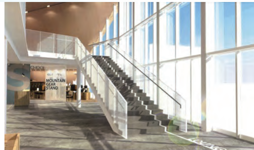
背景に広がる山並みをモチーフに、白と木目を基調とした外観と明るく開放的な室内空間

先進的なデザインとサービスを取り入れることにより、お客様の満足度向上に積極的にコミットいたします。