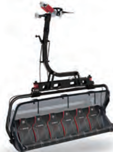
最新型 6人乗りチェアリフト