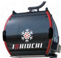
最新型 10人乗り Gondラキャビン

シンボリックなリフトの新設が、石打丸山スキー場の新たな魅力づくりに繋がり、新規顧客層の開拓および来場者数の増加が期待できるなど、地元宿泊施設や飲食施設にとってもその波及効果は大きいと考えられます。