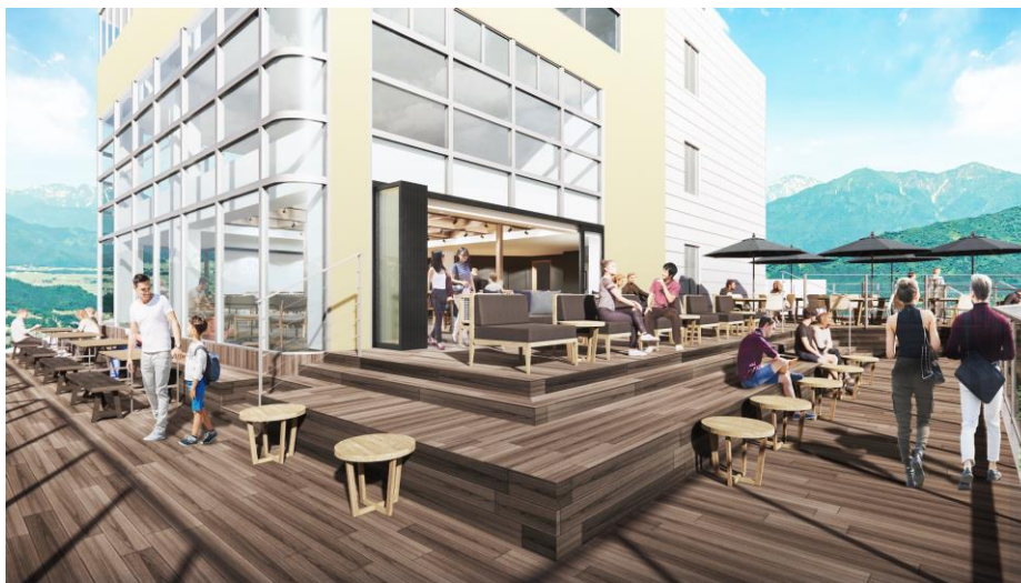
エリア最大級の新展望テラス(イメージ)

絶景を見渡せる床面積232㎡の広々とした新展望テラスでは、常設のウッドデッキにソファやテーブルが並び、ゆったりとしたくつろぎの時間と地元の食材を使用したフードメニューやドリンクメニューをお楽しみいただけます。