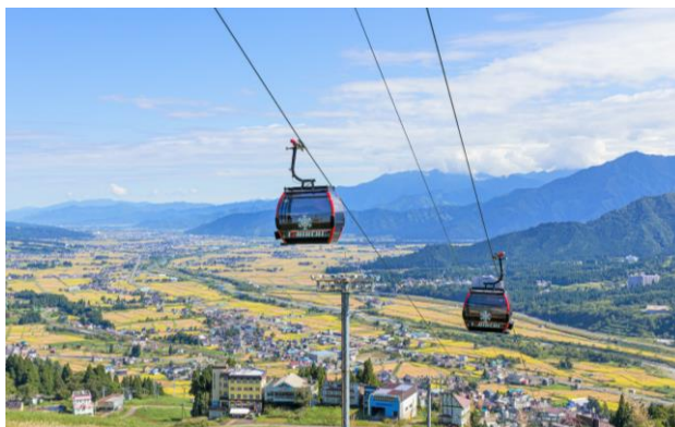
新鋭コンビリフト（夏期はキャビンのみで運行）「サンライズエクスプレス」

新展望テラスへは「サンライズエクスプレス」で空中散歩を楽しみながら快適にアクセスいただけます。