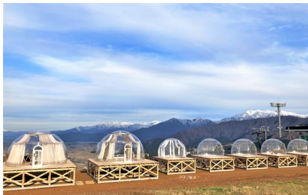
プライベート空間を演出するドームテント(イメージ)

雪上グランピング施設として人気の「ドームテント」が、この夏、冷房設備を完備し登場します。食事付きプランの販売も予定しており、天候の急変に左右されることのない冷房が効いた快適なプライベート空間では、雄大な景色の一体感と飲食をお楽しみいただけます。ドームテントのご利用は事前予約制となっています。